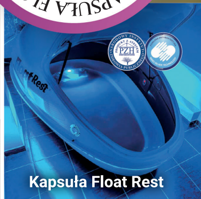
Kapsuła Float Rest

PAŁAC ŁAZIENKI II SANATORIUM UZDROWISKOWE W CIECHOCINKU UL. RACZYŃSKICH 6, 87-720 CIECHOCINEK