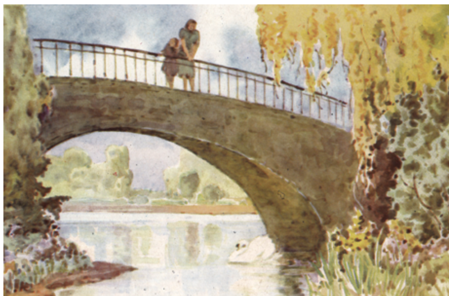
Obraz przedstawia nieistniejący już dzisiaj mostek nad stawem w parku Tężniowym.