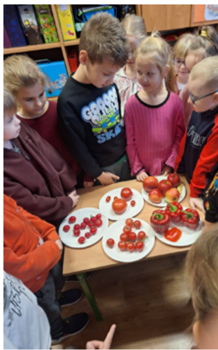
fol. Szkole Podstawowej nr 3