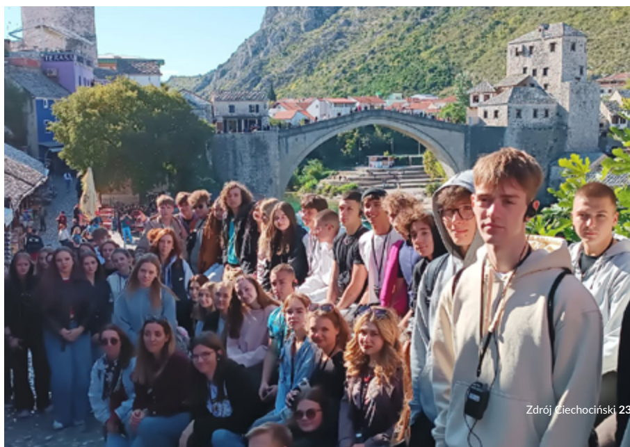
fol. Liceum im. S. Staszica