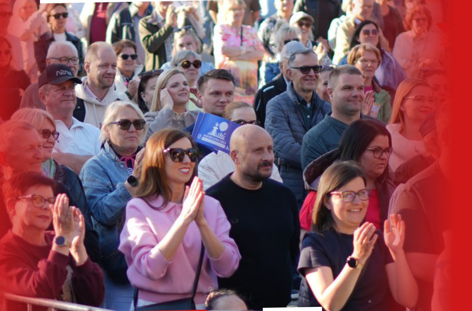
KAPELA NIE DO ZDARCIA