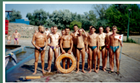
Szkolenie ratowników

Te wody trzeba było mieszać tak, żeby średnie zasolenie w basenie było bezpieczne, poniżej jednego procenta. To nie był basen leczniczy, gdzie pacjent wchodził po zgodzie lekarza. Tu przychodzili wszy-