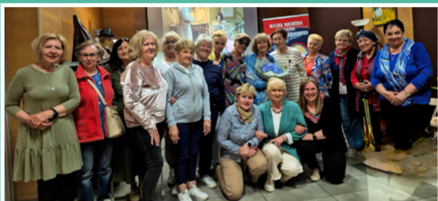
fol. Uniwersytet dla Aktywnych

Tak minął studentom UdA maj - krótko mówiąc: aktywnie, twórczo i w dobrym towarzystwie.