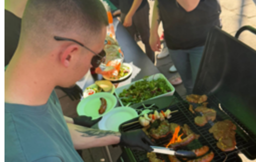
fol. Stowarzyszenie Szmaragdowy Paw