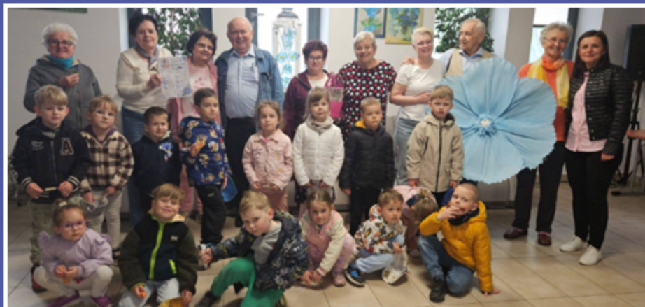
fol. Klub Senior+ „Niezapominajka”

W Klubie Senior+ „Niezapominajka” obchodzono Dzień Niezapominajki. Spotkanie upłynęło w serdecznej atmosferze, a wyjątkowymi gośćmi były dzieci z Przedszkola Samorządowego „Bajka”, które odwiedziły seniorów z życzeniami i uśmiechem.